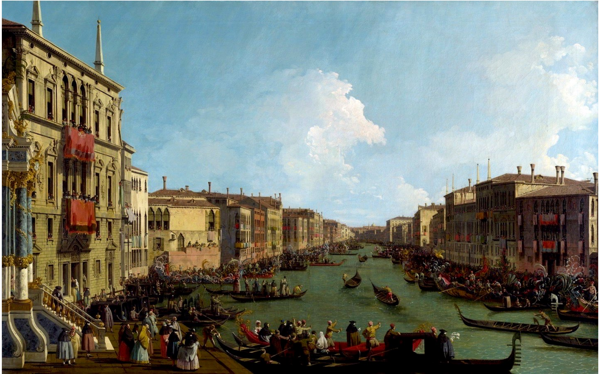
Una regata en el Gran Canal , Canaletto (1735), óleo sobre lienzo, 77,2 cm x 124,7 cm. The Royal Collection de Windsor (Reino Unido).